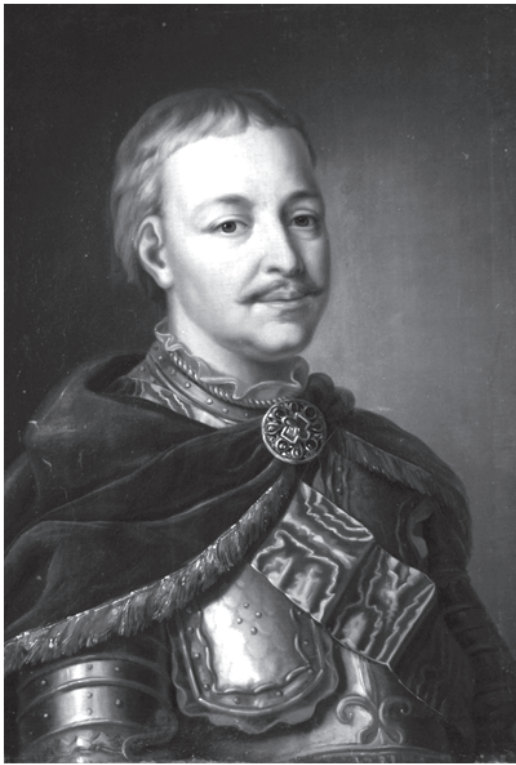
Невідомий художник. Портрет Івана Мазепи в латах та з "андріївською" стрічкою Дніпропетровський художній Музей

Відомо, що І.Мазепа став кавалером ордена Андрія Первозванного у 1700 р. 5 У січні того року Петро I викликав його до Москви. Гетьманське посольство у складі 48 осіб прибуло до російської столиці 22 січня і залишалось у ній до 25 лютого. 8 лютого цар вручив гетьману грамоту на орден святого апостола Андрія Первозванного 6 . Першим таку нагороду у 1699р. отримав граф Федір Головкін. Як свідчать документи, орден гетьман отримав лише у серпні, про що свідчить