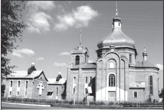
Церква 2000-ліття Різдва Христового

Франсуа Блондель-молодший, теоретик французької архітектури XVIII ст., сказав: "Задоволення, яке ми відчуваємо від прекрасного витвору мистецтва, залежить