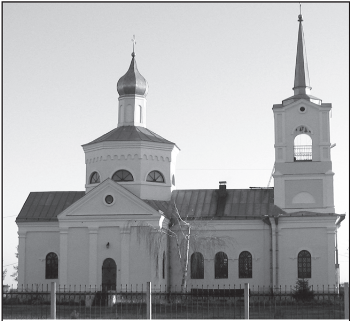
Церква Св.Феодосія Углицького

Проект іконостаса храму Різдва Христового також належить отцю Анатолію. Те, що саме одна людина є автором проекту храму, іконостаса і автором його ікон, а також настінного живопису, – це те найвдаліше поєднання архітектури, різьблення і малярства, якого домагалися ще в давні часи і яке зменшує або навіть виключає можливість еклектичних рішень. Так, наприклад, зараз за кордоном заведено такий порядок, що іконостас планує архітектор храму чи маляр ікон. Отець Анатолій дуже ретельно опрацював оригінальний іконостас (до речі, за браком коштів, він зроблений з відходів виробництва меблевої фабрики), різьблення кожної ікони і деталі іконостаса, а тому всі складові мають викінчений вигляд. З тонким чуттям декоративності і ритму написані образи святих, Богородиці, Ісуса Христа. Їх характеризують глибока людяність і душевні переживання. Це стосується як настінного живопису, так і ікон. Ікони змальовані у великих формах, широкими мазками, а постаті відзначаються осяжністю і масивністю. Живопис от. Анатолія не залишає байдужим нікого, хто любить мистецтво церкви.